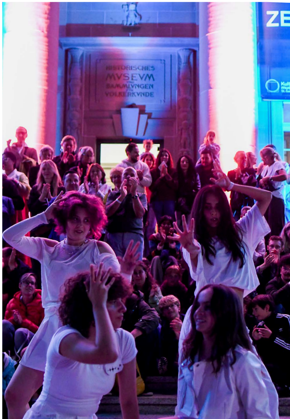
Die K-Pop Dance Academy an der Museumsnacht.