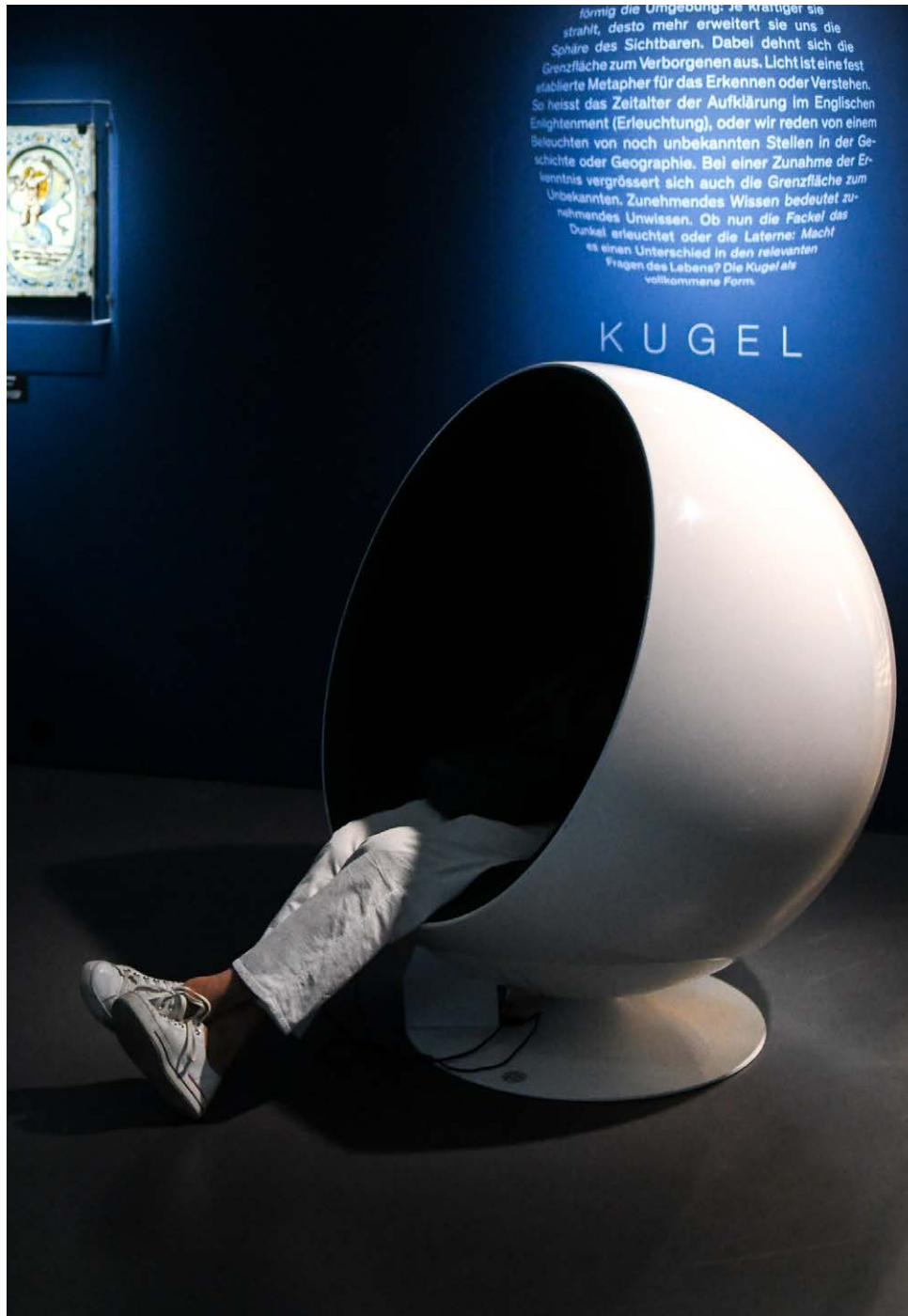
Hörstation in der Ausstellung «Raum – Zeit – Geist. Wir formen uns die Welt».