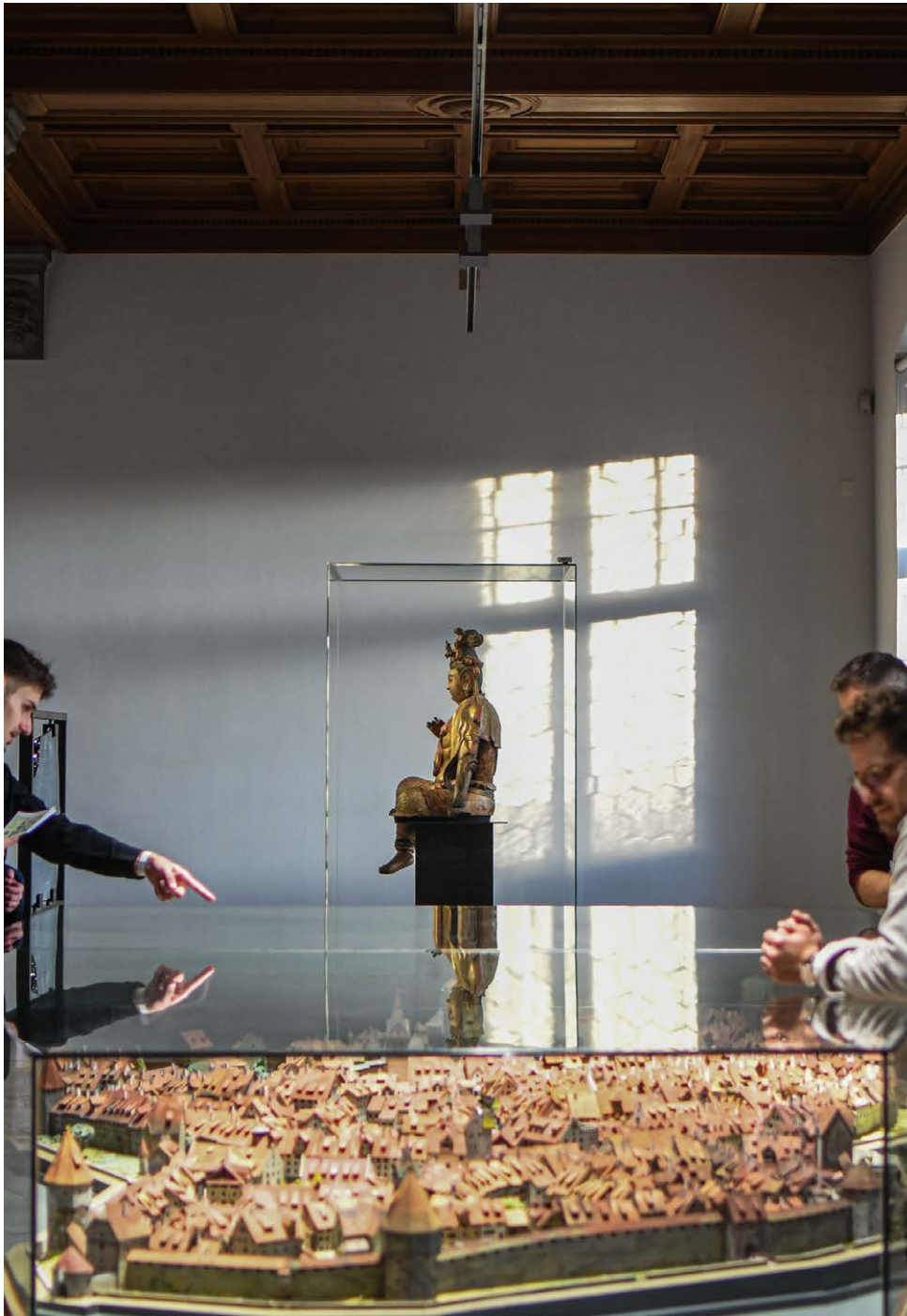
Stadtmodell im Hauptsaal.