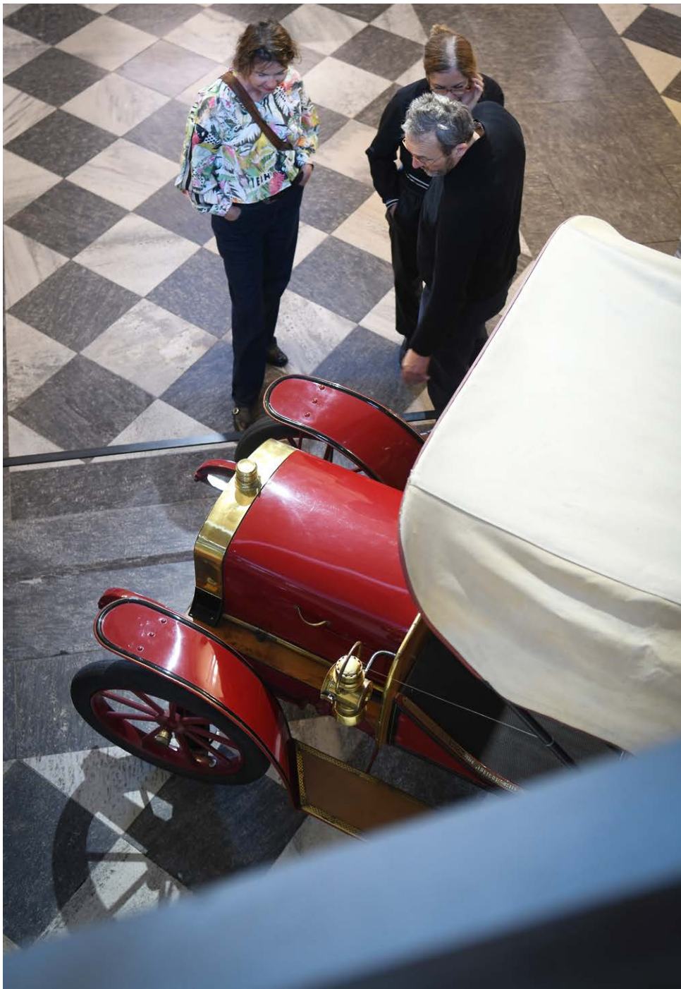
Aus der Museumssammlung: Automobil «Turicum», ausgestellt im Foyer.