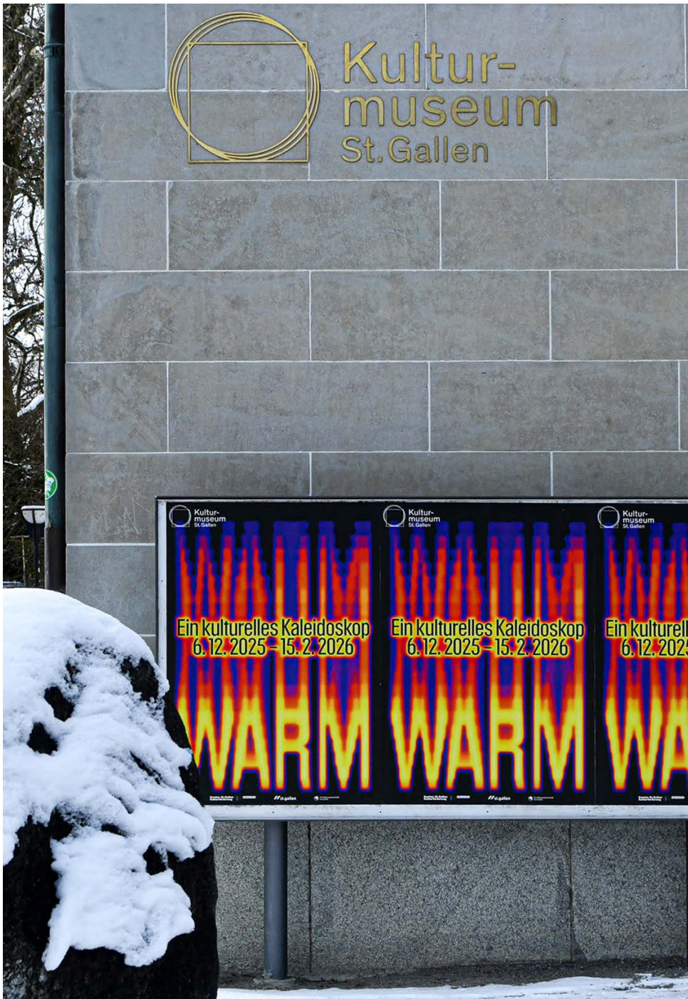
Plakatwerbung an der Ostseite des Museums.