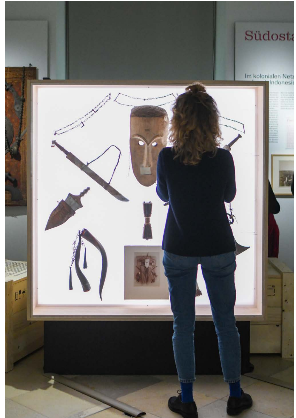
Rekonstruktion der Ausstellungsgestaltung im Völkerkundemuseum um 1900.