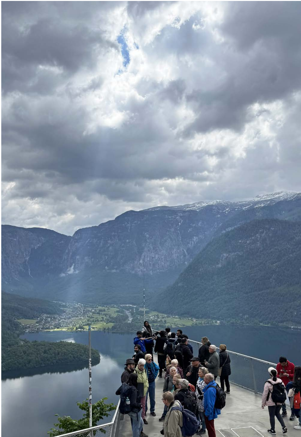
Kulturreise des Freundeskreises: Welterbeeblick im Salzkammergut.

Jahren. Seit der Aneignung des Feuers durch den Menschen ist die Wärmetechnologie ein wesentlicher Strang durch die Kulturgeschichte hindurch. In der Ausstellung standen die Exponate, darunter das Element einer römischen Fussbodenheizung, zeitlich geordnet vor der an die Wand projizierten historischen Temperaturkurve. Es sind schliesslich die klimatischen Verhältnisse, zu denen das körperliche Wärmebedürfnis in Relation steht. Werden wir uns in Zukunft wegen der Klimaerwärmung eher mit Kühlsystemen beschäftigen müssen? Weihnächtlich hingegen ist doch der metaphorische Gehalt, dass wir in der kältesten Zeit das Fest der Wärme feiern.