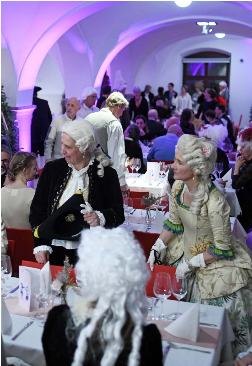
Barockball anlässlich der Ausstellung «Prunkschlitten – Reise in die Barockzeit».