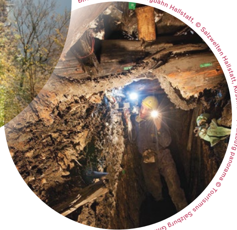
Salzbergbahn Hallstatt | Salzburg panorama | Salzburg panorama