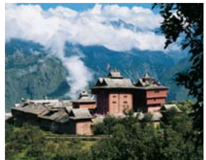
Bhimakali-Tempel von Sarahan Günter Gessinger, 1995