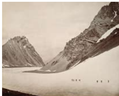
Eine Trägerkarawane überquert den Manirung-Pass ins Spiti-Tal Samuel Bourne, 1866