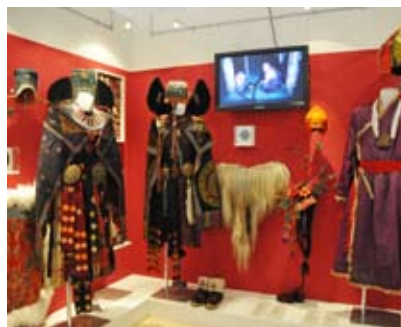
Blick in die Ausstellung 1