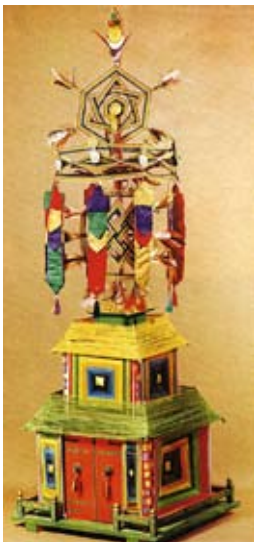
Ein ganz besonderes Objekt (Animismus): Geisterfalle Tibet 155 cm Völkerkundemuseum Zürich

Den Schluss der Ausstellung bildet ein begehbare Mandala mit religiösen Objekten des tibetischen Buddhismus. In diesem Raum wird von Mönchen des Klosters Rikon im November ein Sandmandala gestreut, das erst am Ende der Ausstellung wieder zerstört wird.