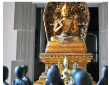
VII Dalai Lama und 12 Mönche aus Holz