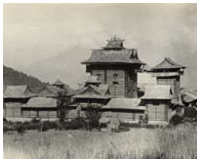
Bhimakali-Tempel von Sarahan Babu Pindi Lal, 1909