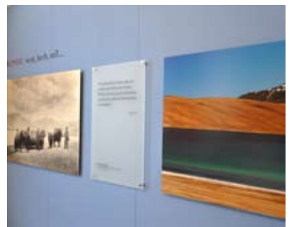
Blick in die Ausstellung 2