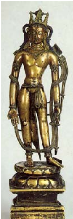
Objekt mit der höchsten Versicherungssumme (2 Mio.): Bodhisattva Padmapani Kashmir, 9./10. Jh. 77 cm Lindenmuseum Stuttgart