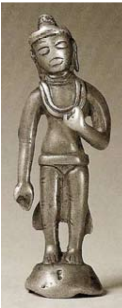
Ältestes Objekt in der Ausstellung: Stehender Buddha Ladakh, 7. Jh. 8,5 cm Museum der Kulturen Basel

St.Gallen beherbergt die einzige und bedeutendste völkerkundliche Sammlung zwischen Zürich, Stuttgart und München. Dies lässt sich durch die Rolle der Textilstadt mit ihren weitreichenden Geschäftsverbindungen sowie diplomatischen und kulturellen Auslandbeziehungen seit dem 18. Jahrhundert begründen. Zu gewissen Regionen haben sich über die Sammeltätigkeit in der Ostschweiz besondere Beziehungen entwickelt, so im Besonderen zum Tibet. Im Jahre 1960 wurden im Kinderdorf Pestalozzi in Trogen AR erstmals 20 Flüchtlingskinder aus dem Tibet aufgenommen. Heute leben etwa 3000 Tibeterinnen und Tibeter in der Schweiz. In Rikon ZH wurde 1967 auf Wunsch des 14. Dalai Lama das erste tibetisch-buddhistische Kloster im Westen erbaut. Vom Mitbegründer Toni Hagen besitzt auch das Historische und Völkerkundemuseum St.Gallen einige Deposita.